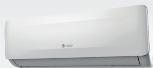
επίτοιχη κλιματιστική μονάδα IKAROS