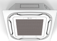
κασέτα 4 κατευθύνσεων